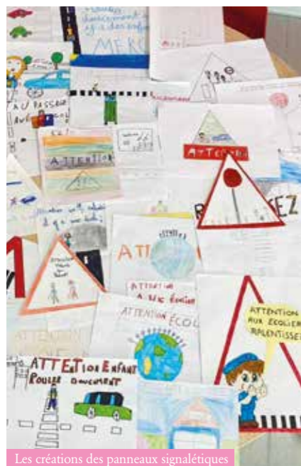
Les créations des panneaux signalétiques

Malgré les contraintes sanitaires, nos jeunes élus ont mené à bien trois projets.