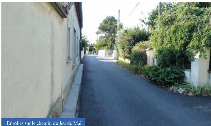
Enrobés sur le chemin du Jeu de Mail

Nous nous sommes rapprochés du Conseil Départemental qui a donné suite à notre demande de reprise des enrobés route de Cabannes et d'amélioration de l'écoulement des eaux pluviales à l'entrée sud des Paluds-de-Novés.