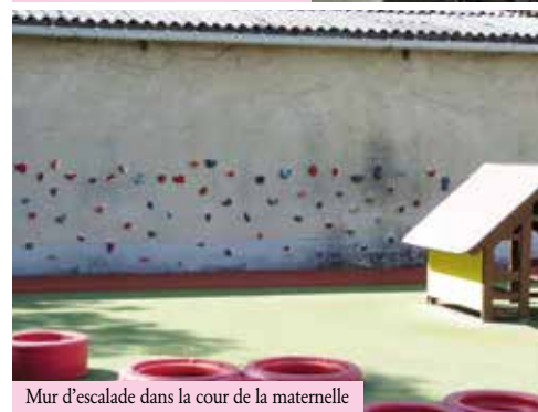
Mur d'escalade dans la cour de la maternelle