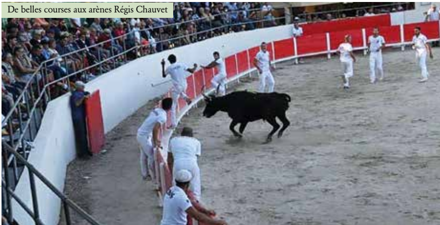
De belles courses aux arènes