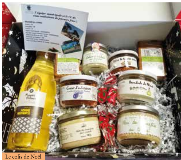
Le colis de Noël

Des permanences sont proposées sur rendez-vous : 04 90 02 14 46, le jeudi matin et le vendredi après-midi.