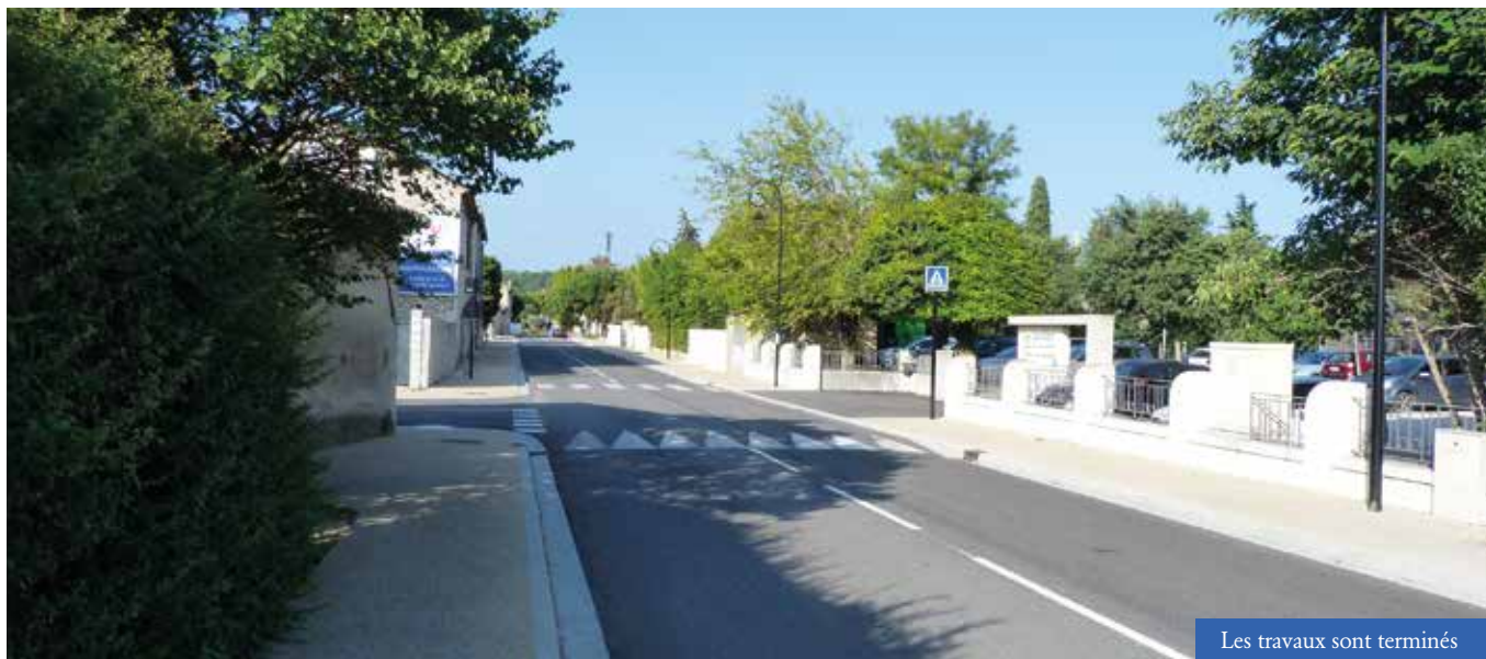
Les travaux sont terminés

Les travaux de mise en sécurité de l'avenue Agricole Viala et de la route de Bonpas étant terminés, le Comité Travaux a programmé, pour cette fin d'année, la poursuite du remplacement en lampes LED, route des Paluds.