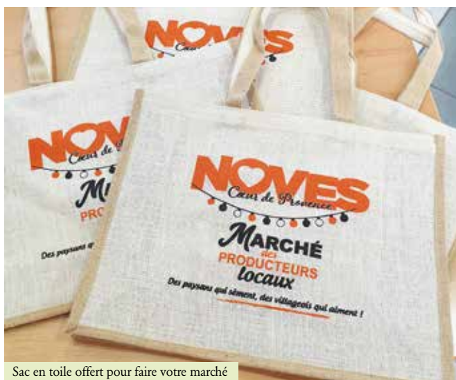
Sac en toile offert pour faire votre marché

Une belle saison pour le Marché des Producteurs Locaux qui s'est arrêté fin septembre.