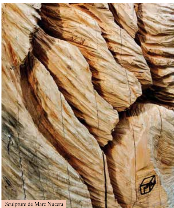
Sculpture de Marc Nucera

« Un arbre mort est toujours chargé de vie, il garde son identité. (...) La personnalité de l'arbre dessine la sculpture à venir. » Marc Nucera.