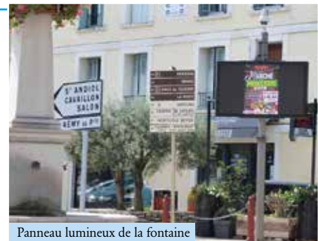
Panneau lumineux de la fontaine

Le panneau lumineux « de la fontaine », Boulevard de la République, a été remplacé par une version plus performante. L'ensemble du parc des panneaux lumineux sera complètement rénové après un dernier investissement aux Paluds. Un complément essentiel pour informer au-delà des canaux digitaux (site et Facebook) qui ne touchent pas l'ensemble de la population.