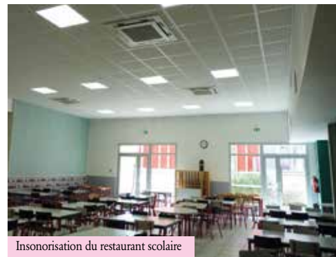
Insonorisation du restaurant scolaire

Aux Paluds, l'école Louise Michel a vu la rénovation totale de sa bibliothèque.