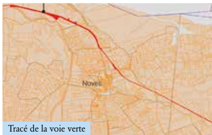
Tracé de la voie verte

C'est toute l'équipe municipale qui est engagée en faveur de l'environnement. Dans le domaine du développement des mobilités douces, le Comité Ecoles, Petite Enfance, Foyer des Jeunes lance la démarche Pédibus pour inciter aux déplacements piétons des écoliers (voir page du Comité Ecoles, Petite Enfance, Foyer des Jeunes). Dans le même sens, Monsieur le Maire a renouvelé sa ferveur pour l'aboutissement de la voie verte auprès des conseillers départementaux. Nous avons été entendus. Le permis d'aménager a été publié mi-septembre. Les travaux, retardés par les conséquences de la COVID et une expertise du pont traversant l'Anguillon, vont reprendre. Une occasion de favoriser les déplacements à pied ou à vélo. Des réflexions d'aménagement des abords pour favoriser l'intermodalité sont déjà en cours.