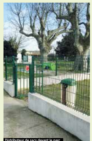
Distributeur de sacs devant le parc