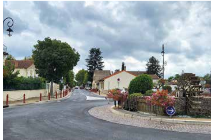
L'avenue de la Libération

La reprise des enrobés sur l'avenue et le rond-point de la roue permet des cheminements en toute sécurité.