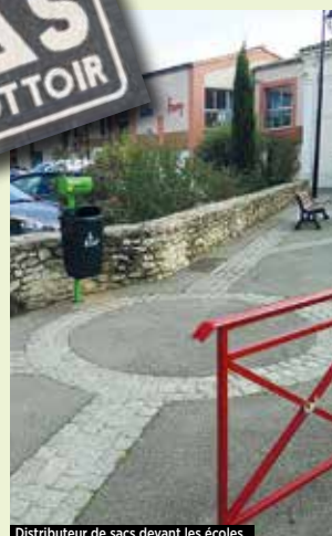
Distributeur de sacs devant les écoles