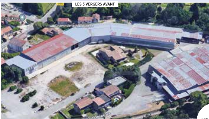
LES 3 VERGERS AVANT

La collecte des eaux de pluie se fera via une noue naturelle qui évitera la création de collecteurs en béton. Un bel exemple de la prise en compte des impératifs environnementaux dans tous nos projets d'aménagement.