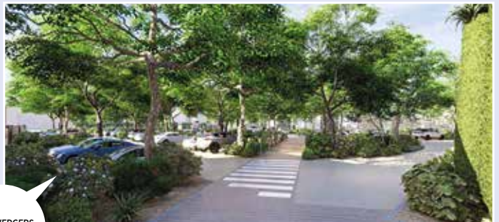
LES 3 VERGERS APRÈS