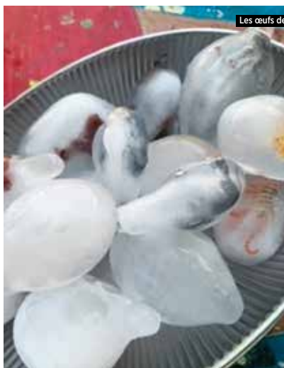
Les œufs de dinosaures

Merci beaucoup aux animateurs ainsi qu'au personnel municipal pour leur implication !