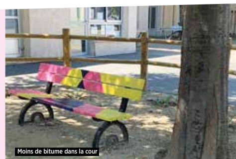
Moins de bitume dans la cour

Un peu moins de bitume pour nos enfants ! Merci à nos jardiniers !