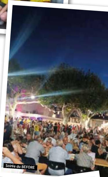
Soirée du BEFORE