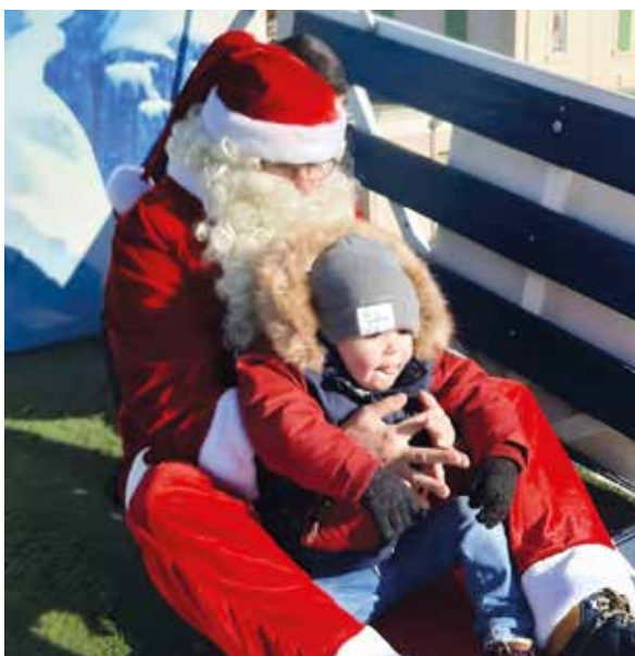
La piste de luge avec le Père Noël : l'attraction tant attendue des enfants

Le Marché de Noël des Paluds se tiendra le samedi 16 décembre 2023, de 14h à 20h (cf. article Les Paluds).