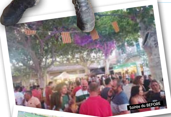
Soirée du BEFORE

Faisons vivre nos commerces locaux, on a tout, on a tous à y gagner !